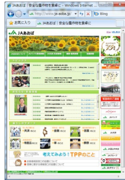
JAあおば ホームページ http://www.ja-aoba.jp/