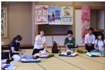
JA共済アンパンマンこどもくらぶ ベビーマッサージ教室 [平成28年7月26日]