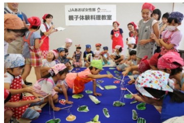
女性部 親子体験料理教室 [平成28年7月25日]