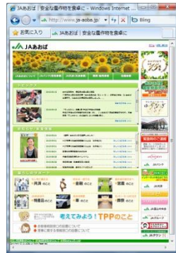
JAあおば ホームページ http://www.ja-aoba.jp/