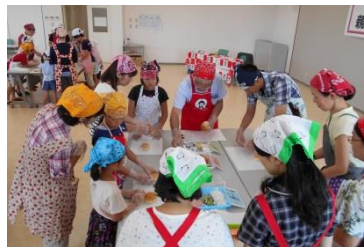
女性部 親子体験料理教室 [平成29年7月22日]