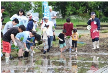
田植えツアー [平成29年5月13日]