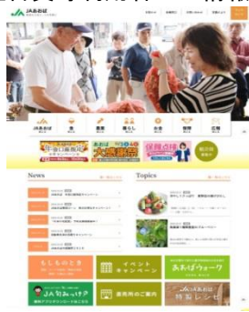
JAあおば ホームページ http://www.ja-aoba.jp/