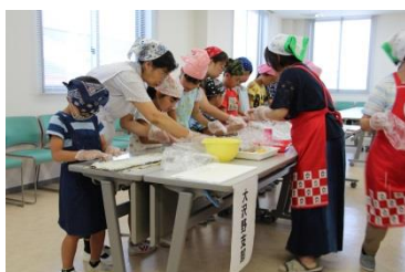
女性部 親子体験料理教室 [平成30年7月21日]