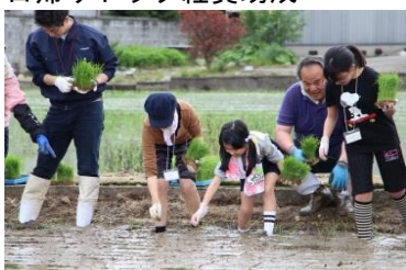
田植えツアー [平成30年5月12日]