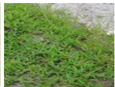
カメムシ類が好む主なイネ科雑草 (左：ナギナタガヤ 右：メヒシバ)