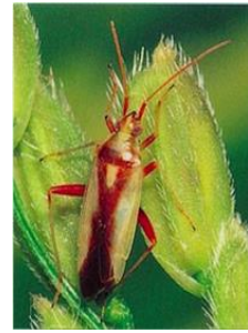
アカスジカスミカメ