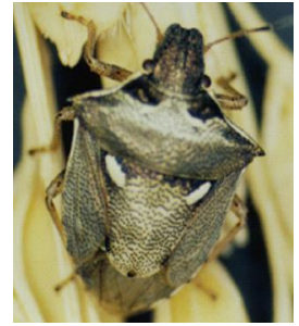
トゲシラホシカメムシ