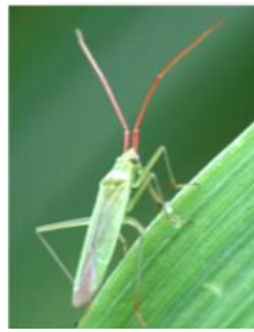
アカヒゲホソミド