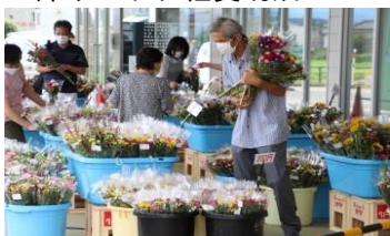
お盆用切花特売フェア [令和2年8月11~15日]