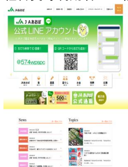
JAあおば ホームページ https://ja-aoba.jp/