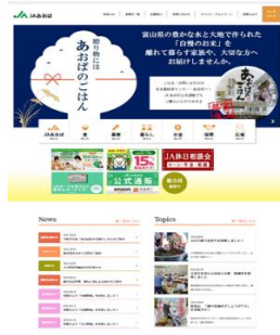
JAあおば ホームページ https://ja-aoba.jp/