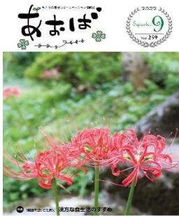
JAあおば 広報誌「あおば」