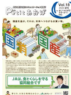
情報提供誌「ぶちあおば」