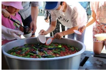
みのり館 夏祭り [令和4年7月30日]