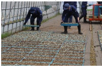
農福連携 高等支援学校農業実習 [令和4年4月19日]