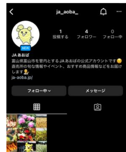
Instagram アカウントページ