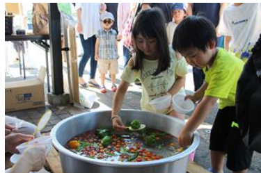
みのり館夏祭り(ふれあい活動) [令和5年7月30日]