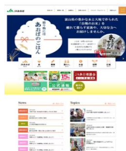
JAあおば ホームページ https://ja-aoba.jp/