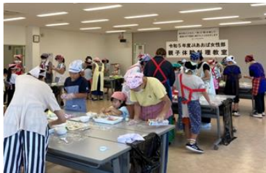
親子体験料理教室 [令和5年7月22日]