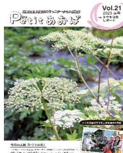
情報提供誌「ぷちあおば」