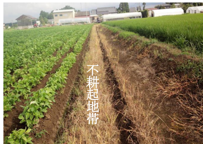
写真 不耕起地帯作成

○ 湛水田隣接ほ場や雨水が流入するほ場では、上記の様に額縁排水溝の内側に不耕起地帯を作ることによって排水性を高める。