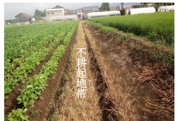
写真 不耕起地帯設置

○ 湛水田隣接ほ場や雨水が流入するほ場では、上記の様に額縁排水溝の内側に不耕起地帯を設置することで水の流入を防止する。