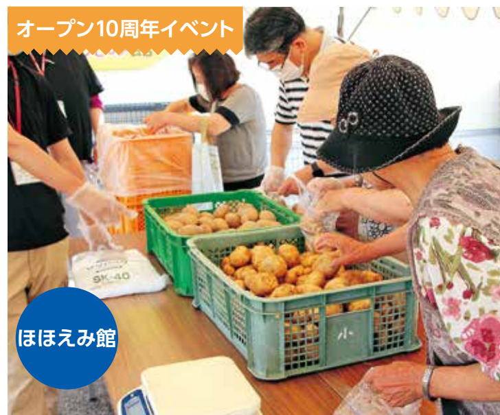
オープン10周年イベント