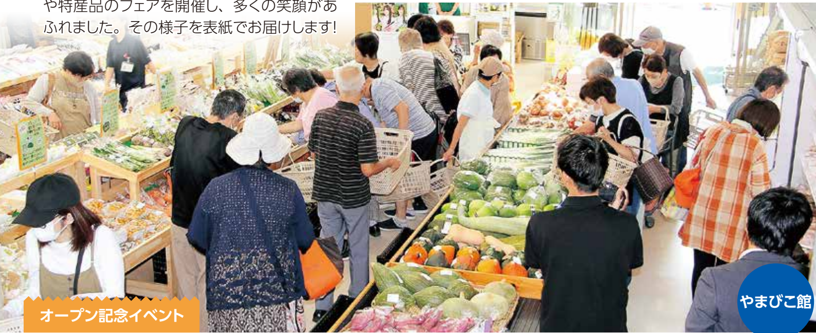
オープン記念イベント

地域のみなさまとともに歩むJAあおばの直売所。令和6年度も、季節ごとのイベントや特産品のフェアを開催し、多くの笑顔があふれました。その様子を表紙でお届けします!